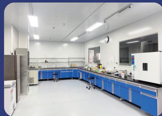
抗原制备纯化实验室