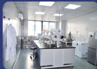
细胞房配套实验室