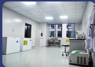
动物房配套实验室